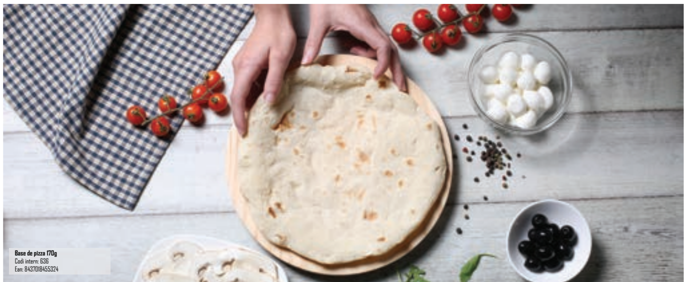
Base de pizza 170g Codi intern: 636 Ean: 8437018455324

Les noves pizzas són allargades i molt ben farcides d'ingredients. Plenes de sabor per a que els consumidors puguin gaudir de fantàstics sopars informals de qualitat.