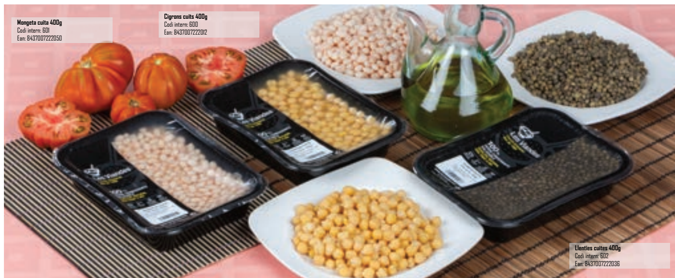
Mongeta cuita 400g Codi intern: 601 Ean: 8437007222050