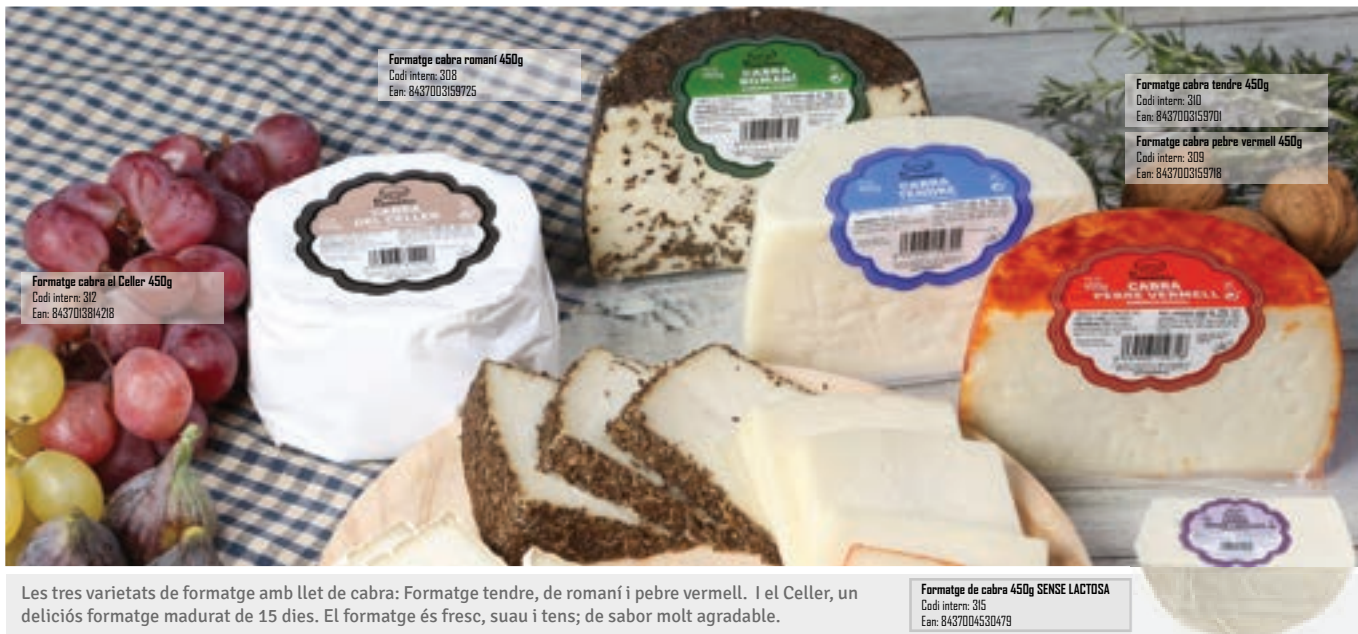
Formatge cabra romaní 450g Codi intern: 308 Ean: 8437003159725