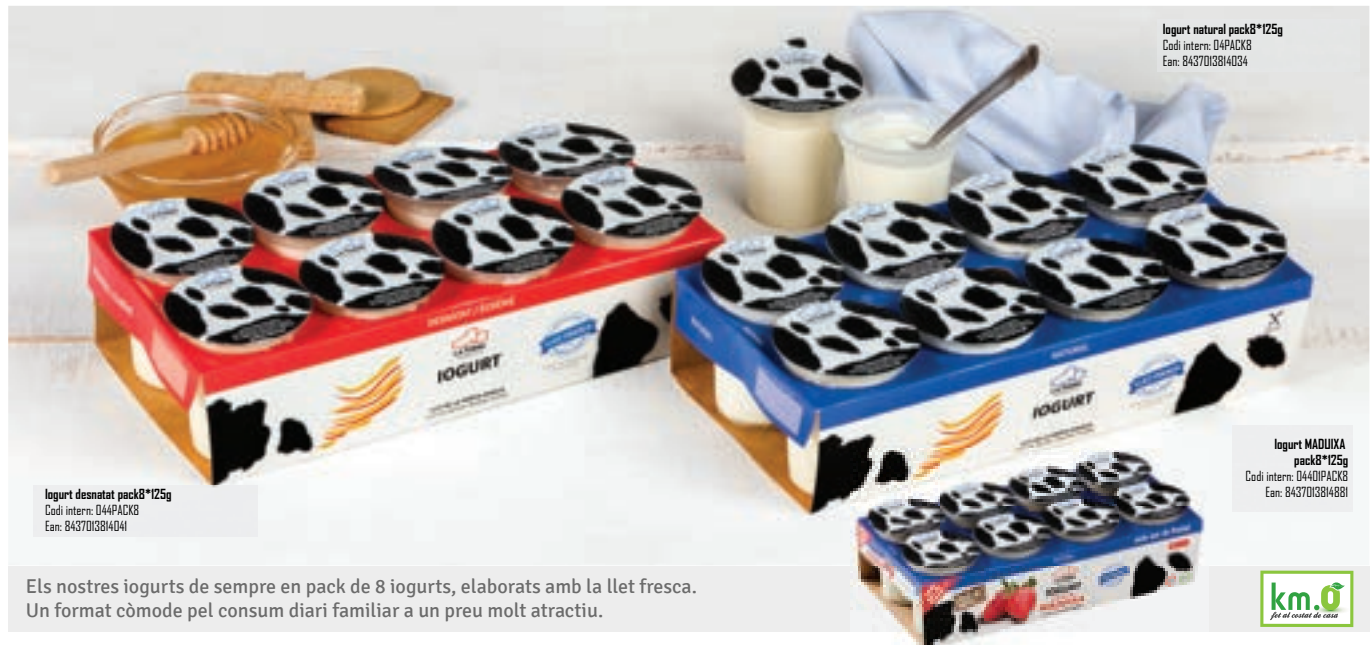
logurt desnatat pack8*125g Codi intern: 044PACK8 Ean: 8437003159404