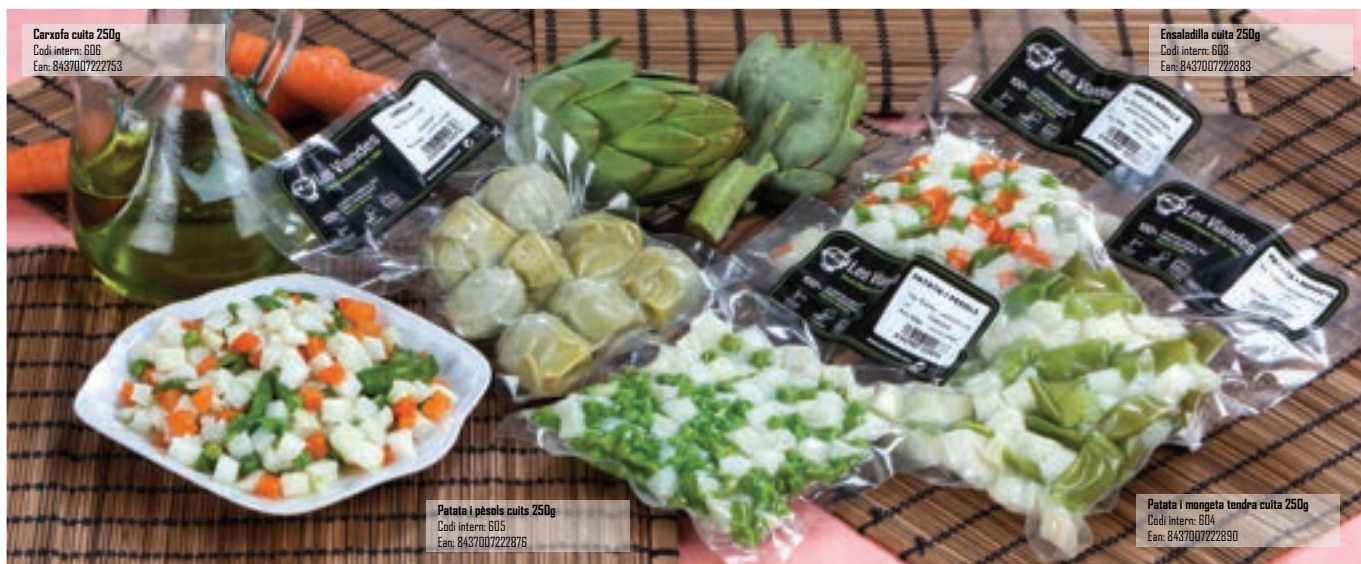
Carxofa cuita 250g Codi intern: 606 Ean: 8437007222753