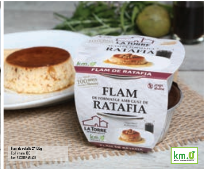
Flam de ratafia 2*100g Codi intern: 100 Ean: 8437018451425