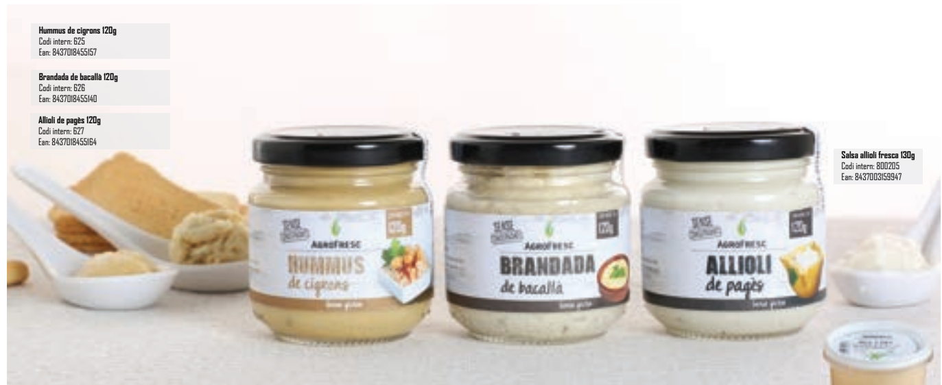
Hummus de cigrons 120g Codi intern: 625 Ean: 8437018455157

Picada d'all i julivert fresc amb oli. Envasada en una còmoda ampolla de 250g amb dosificador. Ideal per a potenciar el sabor dels teus plats de peix i marisc, carn o patates. Sense conservants.