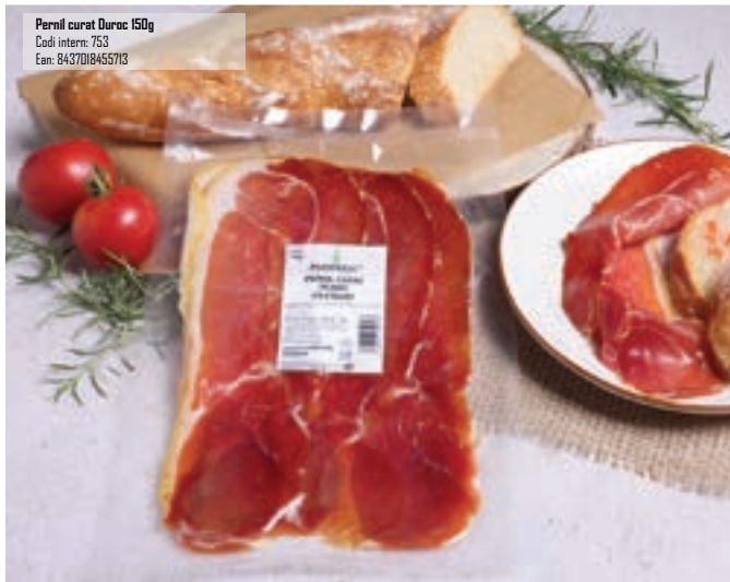
Pernil curat Duroc 150g Codi intern: 753 Ean: 8437018455713

Pernil d'espatlla de porc ibèric d'enceball i encenalls de pernil ibèric, molt sucosos i exquisits al paladar.