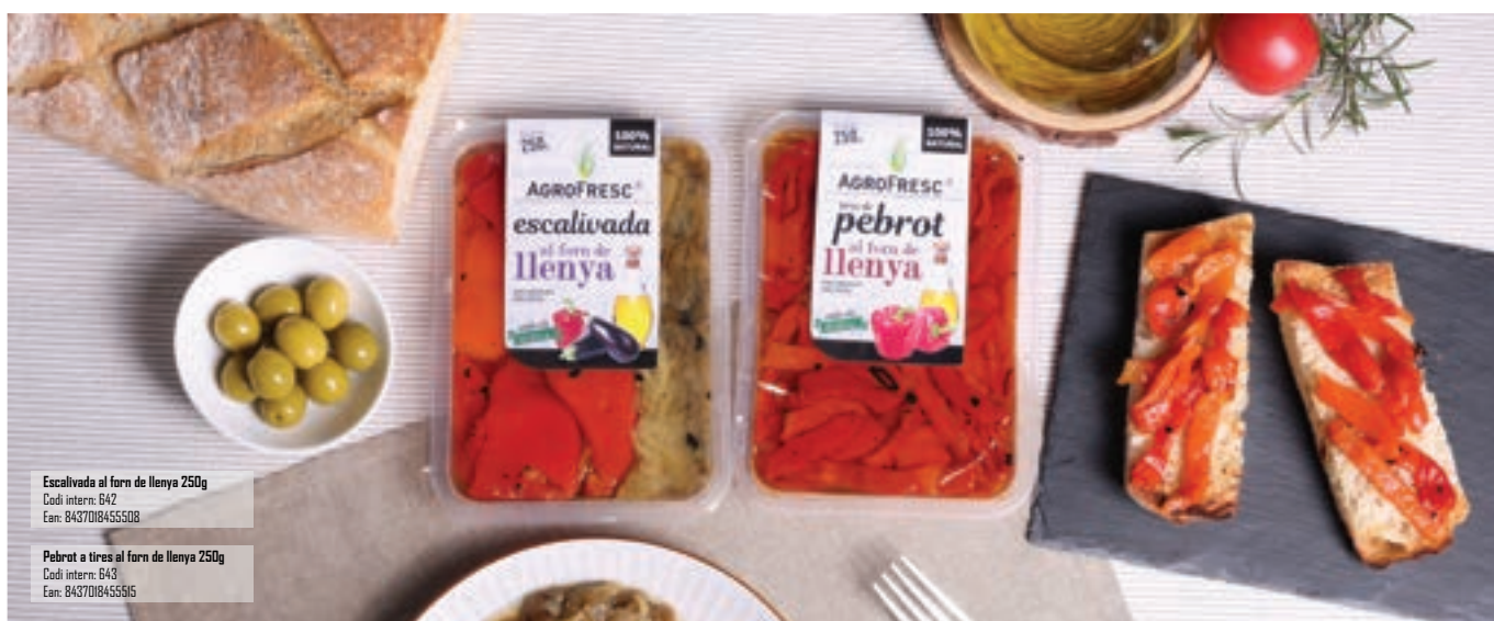
Escalivada al forn de llenya 250g Codi intern: 642 Ean: 8437018455508

Verdura cuita al buit, sense atmosfera protectora, per a que mantingui l'aroma, la textura i el sabor del producte. No fa falta escórrer les verduretes per a cuinar-les ni per a consumir-les al moment.