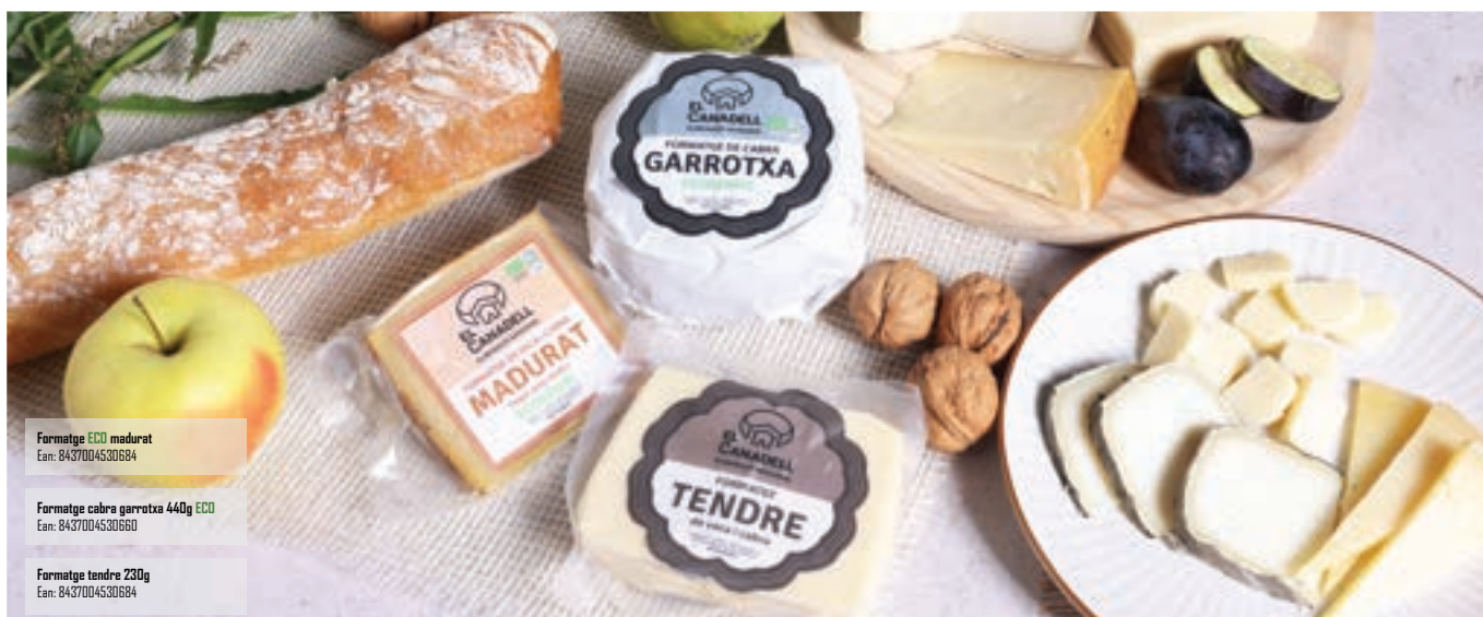
Formatge ECD madurat Ean: 8437004530684

Ests formatges són semicurats, elaborats amb llet pasteuritzada d'ovella i una curació mínima de 45 dies. La pasta és de sabor suau i molt agradable, amb notes de mantega i herbes aromàtiques.