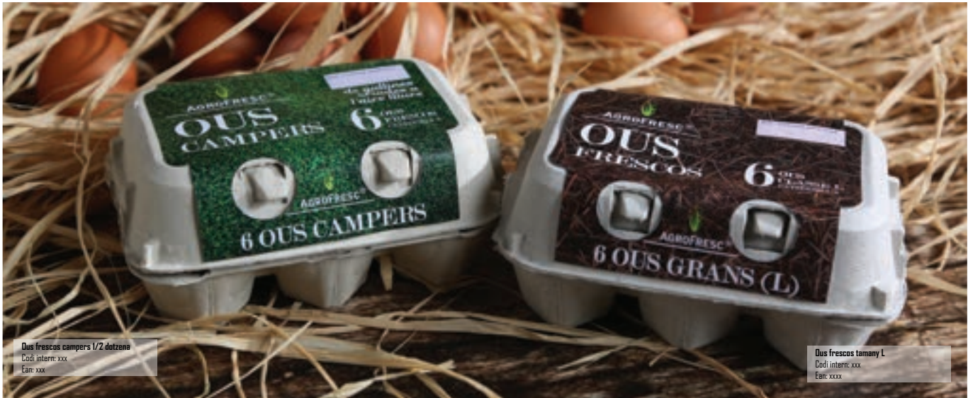
Ous frescos campers 1/2 dotzena Codi intern: xxx Ean: xxx