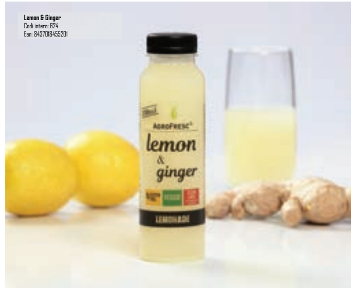
Lemon & Ginger Codi intern: 624 Ean: 8437018455201

El suc de taronja natural d'Agrofresc està elaborat amb taronges seleccionades de gran qualitat. Començar el dia amb un bon suc de taronja natural ens aporta energia i, a més, ens ajuda a purificar l'organisme i a millorar el moviment intestinal.