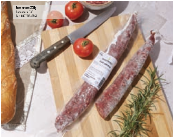
Fuet artesà 200g Codi intern: 748 Ean: 843701845564

Fuet elaborat de manera artesanal amb carn de porc Duroc de gran qualitat, amb el punt de pebre ideal i elaborada amb tripa natural.