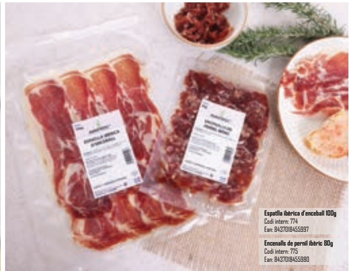
Espatlla ibèrica d'enceball 100g Codi intern: 774 Ean: 8437018455937

Fuet elaborat de manera artesanal amb carn de porc Duroc de gran qualitat, amb el punt de pebre ideal i elaborada amb tripa natural.