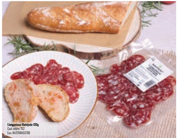
Llonganissa filetejada 100g Codi intern: 752 Ean: 8437018455706

Llonganissa i fuet elaborada de manera artesana amb tripa natural. I pernil 50% Duroc filetejat, de sabor intens i molt agradable.