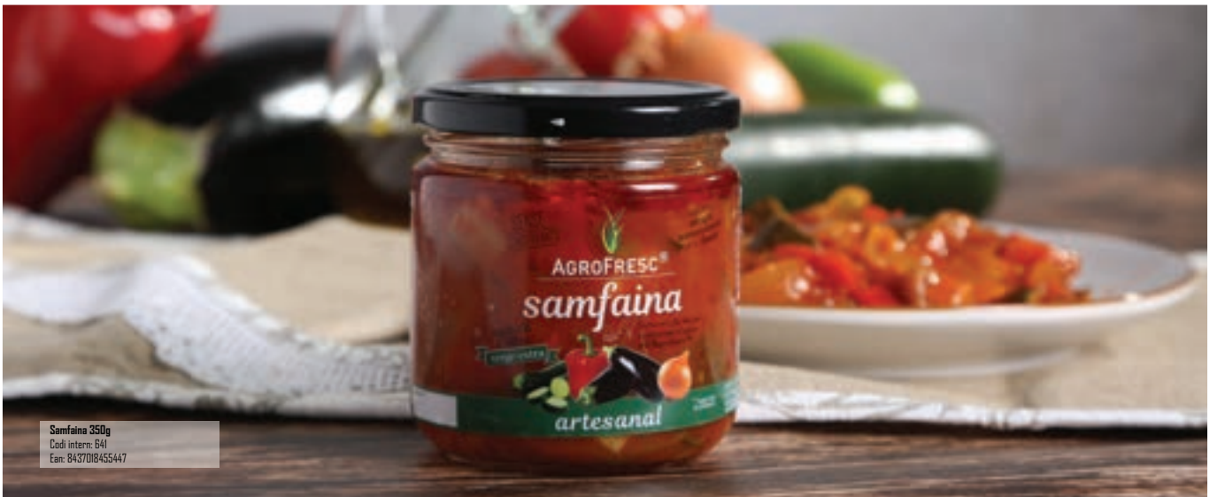
Samfaina 350g Codi intern: 641 Ean: 8437018455447

100% tomàquet ratllat d'origen mediterrani. Totalment natural, sense conservants. Ideal per a sucar amb pa. Cal afegir oli i sal al gust.