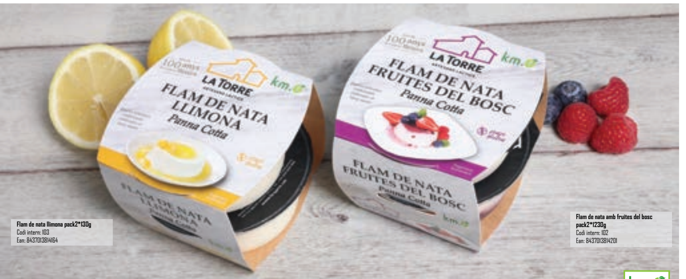
Flam de nata llimona pack2*130g Codi intern: 103 Ean: 8437013814164

Una combinació deliciosa per a qualsevol paladar: Partim d'una base del nostre flam de formatge artesà i el deliciós caramel amb el toc fi de gust de ratafia. Un postre autèntic que representa molt bé la cultura del nostre país.