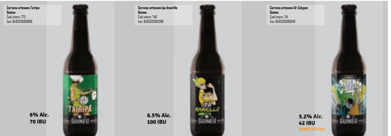
Cervesa artesana Txiripa Guineu Codi intern: 773 Ean: 8435333100868

ALE WEIZENBOCK: cervesa ale basada en blat, maltosa i afruïtada, de la família Weissbier però amb un subtil to més pàl·lid i un agradable sabor més intens i amb més cos. Sense gluten. Sense pasteuritzar. Sense filtrar. Alc 6,5% vol.