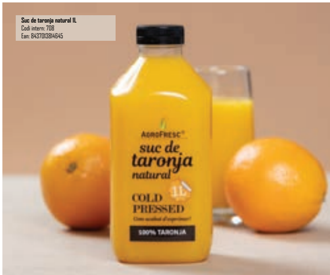
Suc de taronja natural 1L Codi intern: 708 Ean: 8437013814645

Sucs vegetals totalment saludables i boníssims, sense sucres afegits, 100% naturals, rics en vitamines, antioxidants i fibra. Una manera molt còmoda per a consumir fruita i verdura.