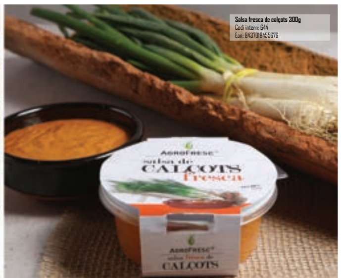
Salsa fresca de calçots 300g Codi intern: 644 Ean: 8437018455676

Una salsa de pagès i artesana; potent de sabor i molt bona, per a que els nostres clients puguin gaudir de grans calçotades amb familiars i amics. En el nostre catàleg trobareu la versió pasteuritzada i la salsa fresca.