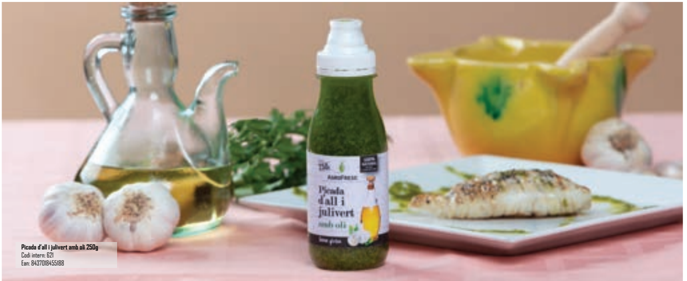
Picada d'all i julivert amb oli 250g Codi intern: 621 Ean: 8437018455188

Picada d'all i julivert fresc amb oli. Envasada en una còmoda ampolla de 250g amb dosificador. Ideal per a potenciar el sabor dels teus plats de peix i marisc, carn o patates. Sense conservants.