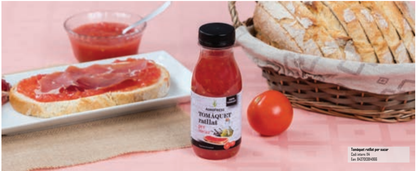
Tomàquet ratllat per sucar Codi intern: 114 Ean: 8437013814966

100% tomàquet ratllat d'origen mediterrani. Totalment natural, sense conservants. Ideal per a sucar amb pa. Cal afegir oli i sal al gust.