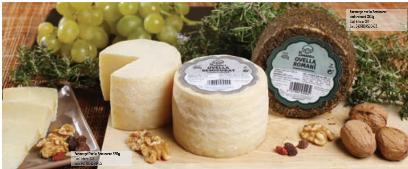
Formatge ovella Semicurat amb romaní 380g Codi intern: 314 Ean: 8437004530462

Les tres varietats de formatge amb llet de cabra: Formatge tendre, de romaní i pebre vermell. I el Celler, un deliciós formatge madurat de 15 dies. El formatge és fresc, suau i tens; de sabor molt agradable.