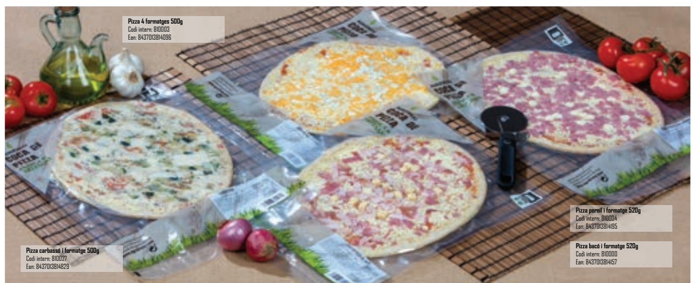
Pizza 4 formatges 500g Codi intern: 810003 Ean: 8437013814096

Una nova base de pizza ideal per a que puguis acabar-la a casa amb els ingredients que més t'agraden i gaudir d'una pizza personalitzada per a tu o per a tota la família! La base és d'uns 22 centímetres de diàmetre i de 170 grams. És fina, lleugera i cruixent, però alhora resistent per a que puguis farcir-la tant com vulguis.