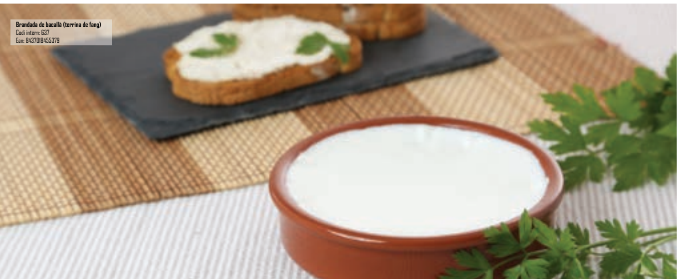
Brandada de bacallà (terrina de fang) Codi intern: 637 Ean: 8437018455379

Hummus de cigrons, brandada de bacallà i allioli, elaborats a l'estil pagès amb ingredients de gran qualitat. L'hummus i la brandada són ideals com a primer plat o bé com a snack o entreteniments abans de l'àpat. I l'allioli... serà un gran acompanyant de graellades i carns a la brasa.