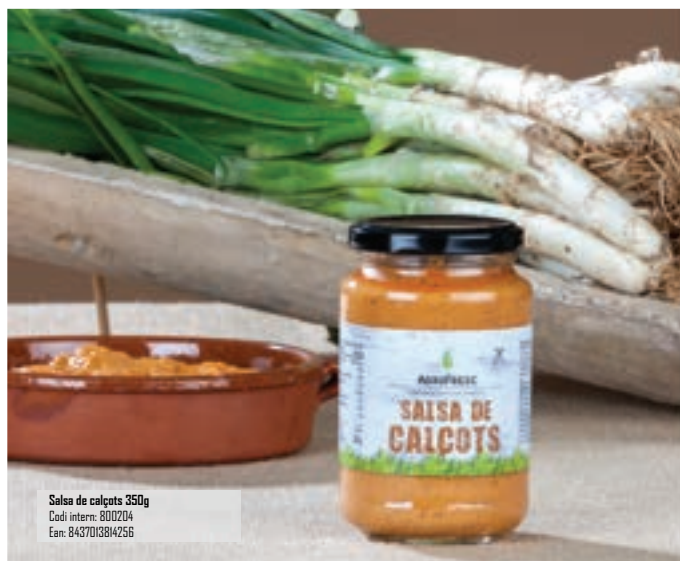
Salsa de calçots 350g Codi intern: 800204 Ean: 8437013814266

Samfaina 100% natural, amb bones verdures i hortalisses cuites a foc lent. La samfaina està elaborada amb tomàquet, pebrot vermell, ceba, albergínia, carbassó, pebrot verd, oli d'oliva verge extra, sal i una miqueta de sucre. Una samfaina com la de tota la vida. Es pot menjar sola o sucari-hi pa, com a acompanyament per a carn, peix, llegums, cargols, arròs o pasta.