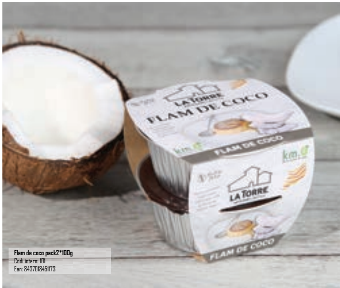
Flam de coco pack2*100g Codi intern: 101 Ean: 8437018451773

Seguint la tradició familiar, a l'obrador de la masia s'elaboren els flams d'ou, formatge i café amb la recepta tramesa de generació en generació.