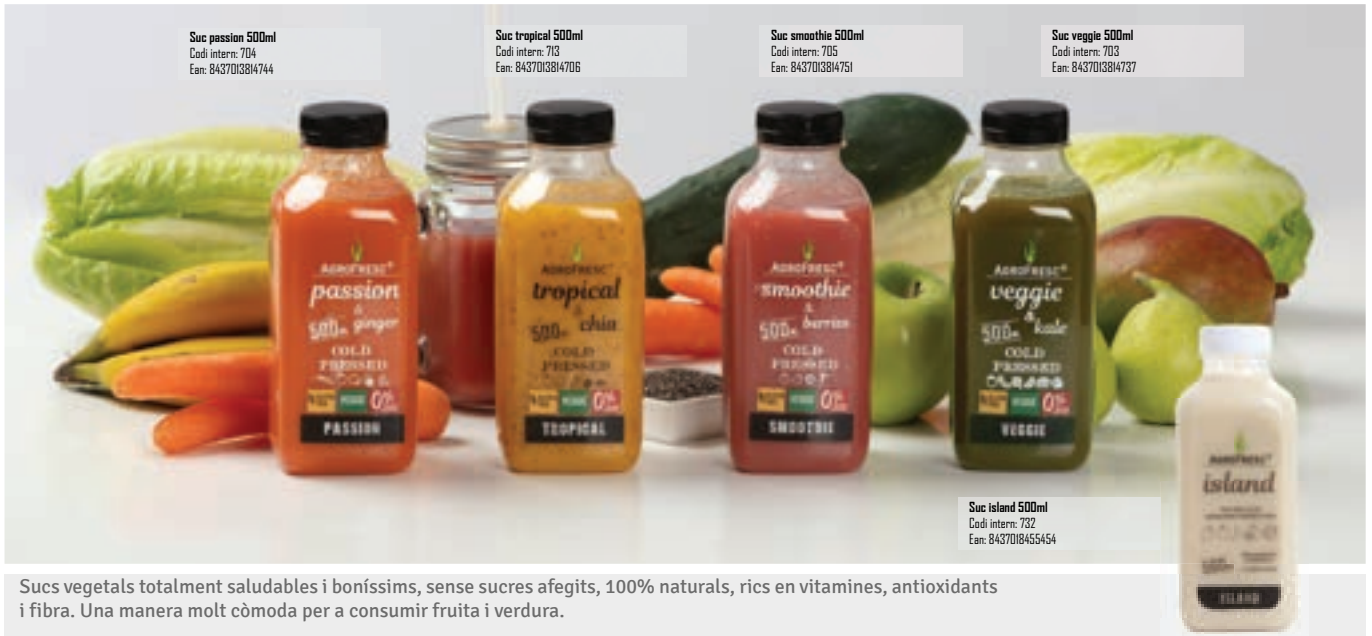
Suc passion 500ml Codi intern: 704 Ean: 8437013814744