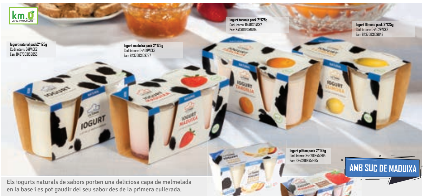
logurt natural pack2*125g Codi intern: 044PACK2 Ean: 8437003159855