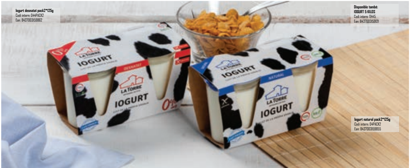
logurt desnatat pack2*125g Codi intern: 044PACK2 Ean: 8437003159862