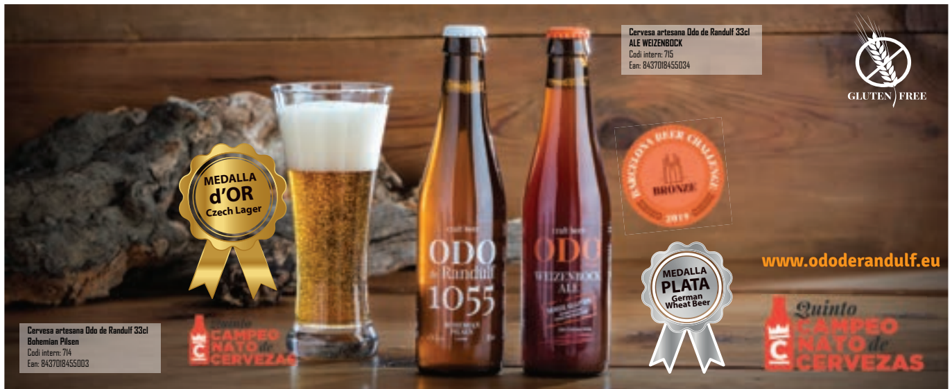
Cervesa artesana Odo de Randulf 33cl Bohemian Pilsen Codi intern: 714 Ean: 8437018455003