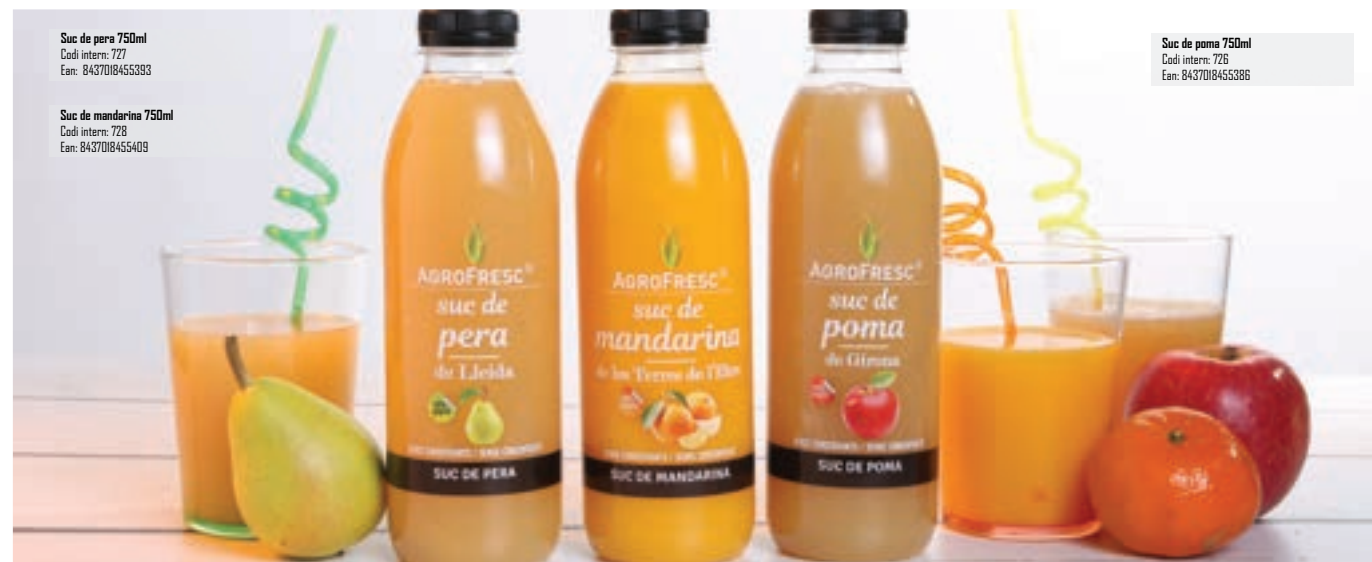
Suc de pera 750ml Codi intern: 727 Ean: 8437018455393

Un refresc ideal per a prendre a primera hora del matí o a qualsevol moment del dia. La llimonada és diurètica, antioxidant, rica en vitamina C. El ginebre accelera el metabolisme, estimula la crema de calories i la oxidació de greixos. El suc és saciant i refresca l'alè.