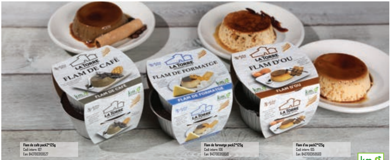
Flam de café pack2*125g Codi intern: 107 Ean: 8437003159527