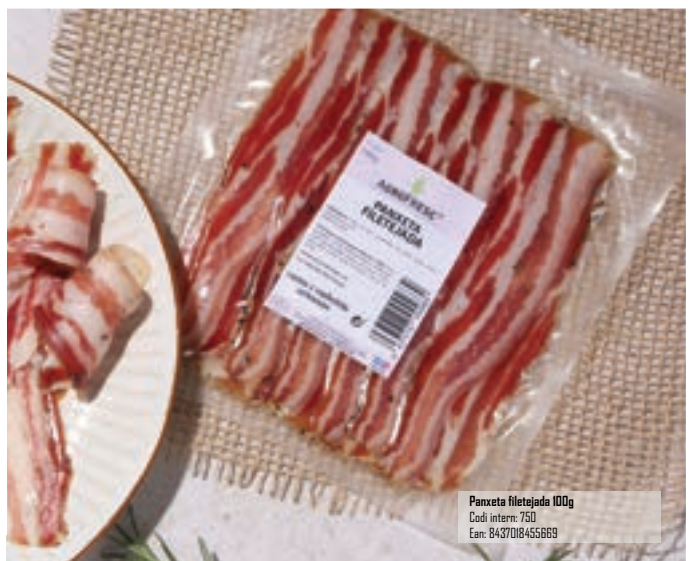
Panxeta filetejada 100g Codi intern: 750 Ean: 8437018455669

El cap de llom és una peça del porc que es troba a la part superior de l'espatlla. És suau, magra i melosa.